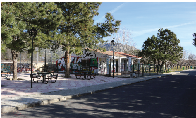
NUEVOS SERVICIOS A LOS VECINOS DE LA PONDEROSA