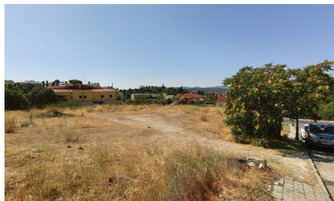
AMPLIACIÓN DE LA ESCUELA INFANTIL JUNTO A LA ACTUAL