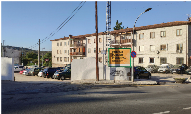
APARCAMIENTO GRATUITO EN EL ANTIGUO VIVERO