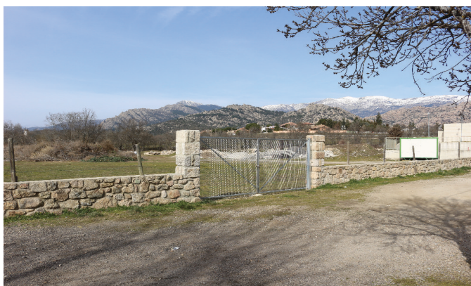
CONTINUACIÓN DE TRÁMITES PARA EL COLEGIO E INSTITUTO EN VALDELOSPIÉS