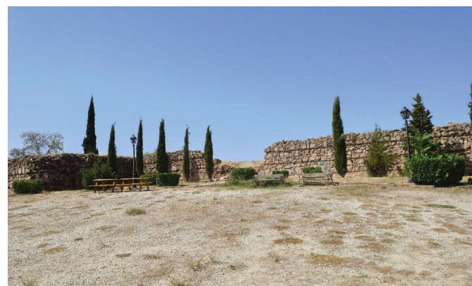
ÁREA DE ESTUDIO ARQUEOLÓGICO EN EL CASTILLO VIEJO

SI QUIERES MÁS INFORMACIÓN SOBRE NUESTRO PROGRAMA Y NUESTRAS PROPUESTAS VISITA WWW.DEMANZANARES.ES